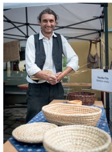
Ošatky ze slámy