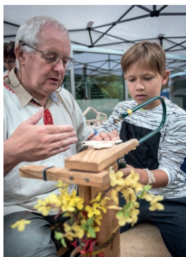
Práce se dřevem