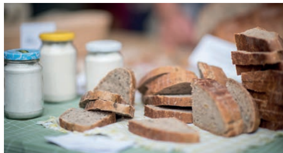
Pečivo a pomazánky