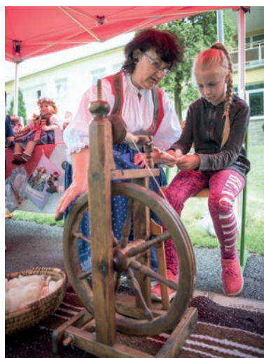
Zpracování ovčí vlny