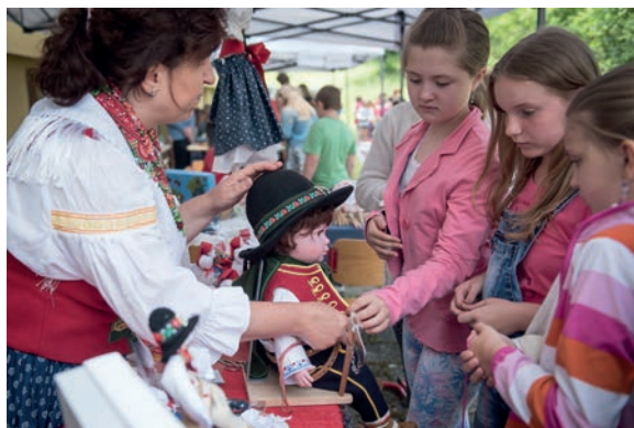
Valašské kroje a panenky