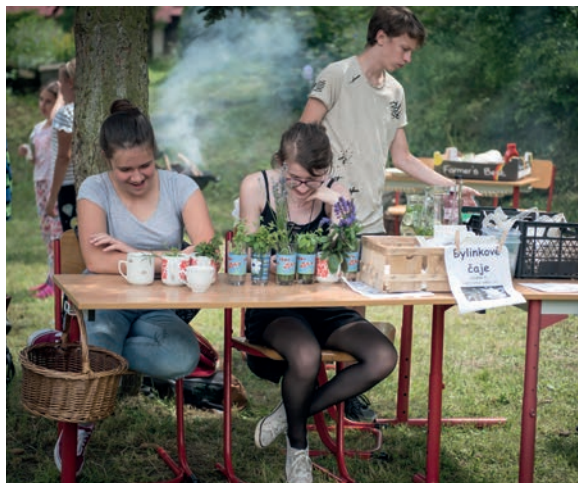
Bylinkové čaje, limonády, smoothie