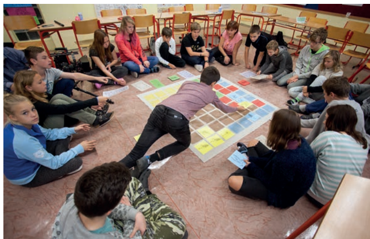
Beseda, část s výukovým programem Opuštěné pole, VIS Bílé Karpaty, foto J. Omelka.

Základní škola v Morkovicích má dlouholetou historii, funguje již více než 90 let. Základní škola má devět ročníků a člení se na první a druhý stupeň. Součástí školy jsou školní jídelna, tři školní družiny, školní klub, studovna, keramická dílna, dílny pro výuku pracovních činností a přírodní školní zahrada. Škola disponuje také tělocvičnou a může využívat sportovní halu, hřiště a koupaliště. Každoročně organizujeme kulturně-vzdělávací exkurze, lyžařský výcvikový kurz i kurzy plavání. Zajišťujeme sportovní akce na okresové a okresní úrovni. Žáci se zapojují do mnoha soutěží a olympiád, preventivních programů a aktivit regionálního či místního charakteru podporující sounáležitost s městem Morkovice-Slížany, okolními obcemi a regionem. Aktuálně má škola 408 žáků. Výuku a provoz školy zajišťuje 29 učitelů, 4 vychovatelky, 8 asistentek pedagoga a 10 správních zaměstnanců. V rámci školy působí školní poradenské pracoviště skládající se ze 2 preventistek, 2 výchovných poradkyň, koordinátorky pro nadané, školního psychologa a školního asistenta. Nabízíme velké množství volnočasových aktivit v rámci školních kroužků. Škola v rámci letních prázdnin zajišťuje příměstské tábory pro děti z Morkovic a okolí.