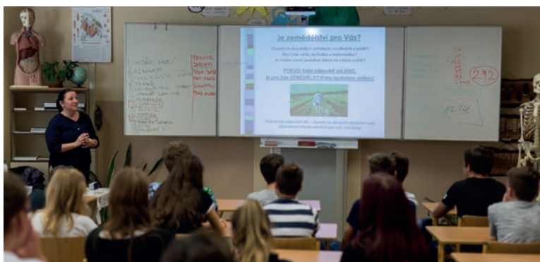
Beseda se žáky, kariéerní poradkyně Úřadu práce Vsetín, foto J. Omelka.

Naše škola je úplnou základní školou s všeobecným zaměřením. Cílem je poskytovat dětem kromě kvalitního vzdělání také pestrou nabídku kulturních a výchovných programů i aktivit, včetně sportovních, ve volném čase v rámci kroužků školního klubu. Podporujeme zdravý životní styl a pohyb žáků v rámci Sazka olympijského víceboje, pravidelně se úspěšně účastníme sportovních akcí, vědomostních olympiád a přírodovědných soutěží s postupem do krajských i celostátních kol. Každý rok zapojujeme žáky a učitele do celé řady projektů, získáváme granty pro další rozvoj školy. Spolupracujeme s ostatními školskými zařízeními, DDM Pastelka Uh. Ostroh, naším zřizovatelem městem Uherský Ostroh, Místní akční skupinou Hornácko a Ostrožsko a partnerskou ZŠ Trenčianská Teplá na Slovensku.