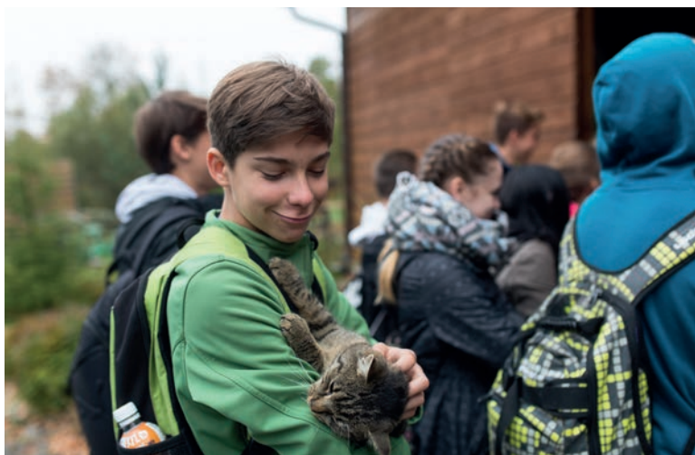
Exkurze žáků, Envicentrum Vysoké Pole, foto J. Omelka.

Zvýšenou péči věnujeme žákům se speciálními vzdělávacími potřebami.