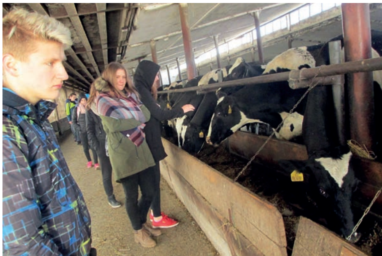
Exkurze žáků, Agrofito Lidečko.

Jsme základní škola, která se nachází v nádherném prostředí na okraji města v centru Beskyd. Již od roku 2015 se pyšníme titulem Ekoškola a celým životem školy se prolíná snaha o zlepšení životního prostředí a finanční úspory. Ekoškolačtví nám pomáhá motivovat a rozvíjet schopnosti dětí i učitelů měnit náš svět. Oslava Dne Ekoškol a Dne Země je pro nás samozřejmostí.