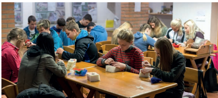
Tvořivý workshop v rámci exkurze, zpracování ovčí vlny, Envicentrum Vysoké Pole, foto J. Omelka.