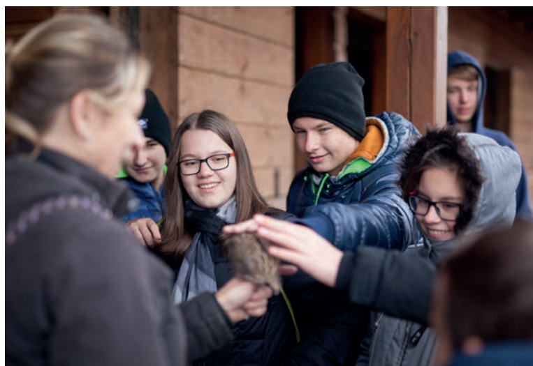
Exkurze žáků, Envicentrum Vysoké Pole, jak to chodí na farmě, foto J. Omelka.