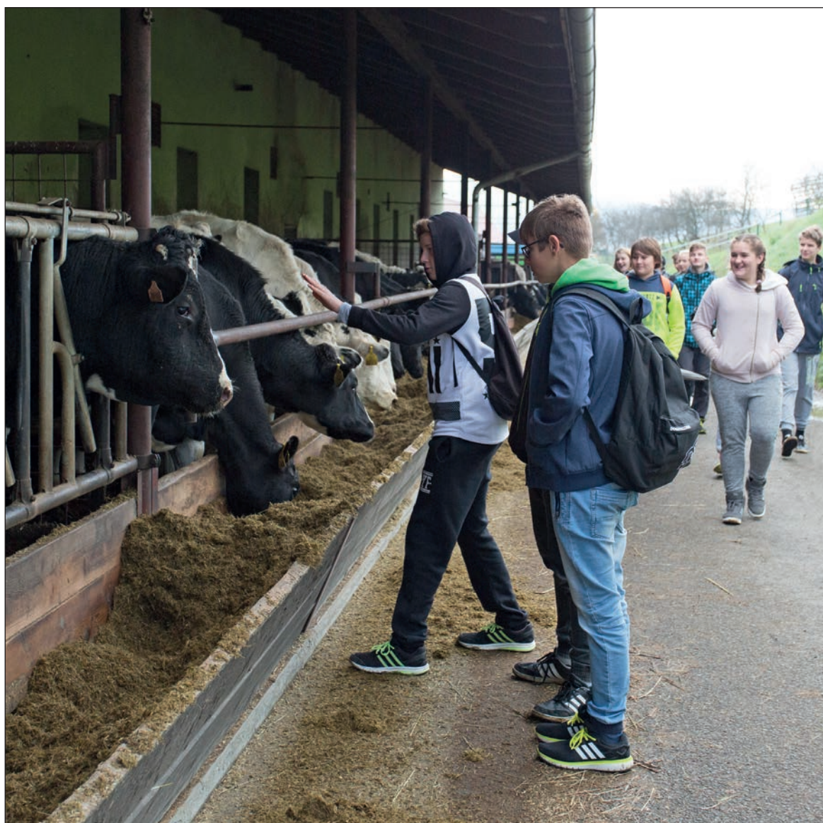
Exkurze žáků na farmu AGROFYTO Lidečko, foto J. Omelka.

Když už přemýšlíme o změnách, kterými zemědělství a potravinářství nesporně projde, pak je důležité najít správnou rovnováhu mezi tradicí a pokrokem. V dobře řízeném zemědělství a potravinářství je ukrytý ten nejdůležitější klíč k našemu zdraví a dlouhému životu. Co pokazíme na polích, ve stájích a následně v továrnách na potraviny, to už žádné zdravotnictví nenaopraví. Za posledních padesát let jsme pokročili – v zemědělství je méně dřiny, více produktů a je to všechno také relativně levnější. Jenomže jsme si v mnoha