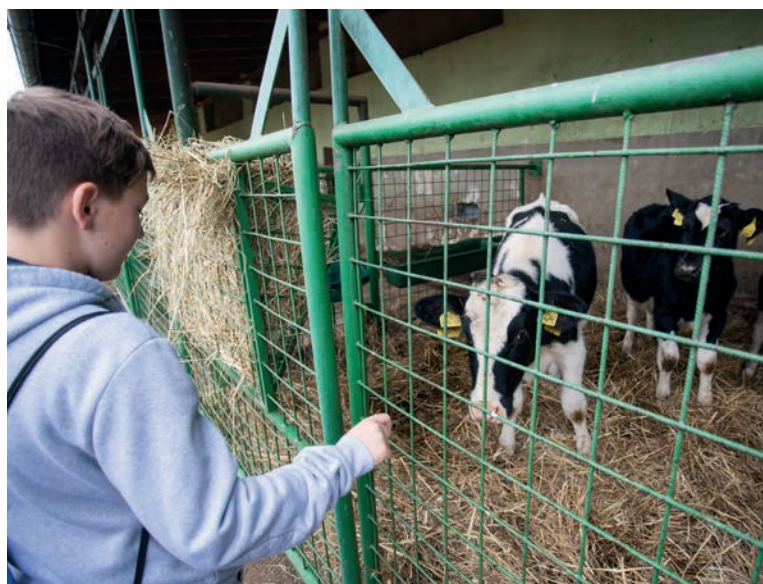
Exkurze žáků, Agrofyto Lidečko.

S velkým ohlasem u rodičů a veřejnosti se setkáváme u akcí jako je Závěrečná kurzu tanečních žáků 9. ročníku, vystoupení školního národopisného kroužku Slavičánek, vystoupení roztleskávaček či mažorettek či celoškolského galaprogramu Hrátky.