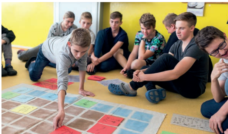
Beseda, část z výukovým programem Opuštěné pole, VIS Bílé Karpaty, foto J. Omelka.