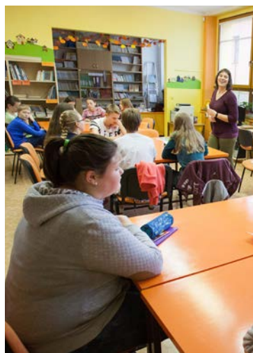
Výukový program, SVČ Klubko Staré Město, foto J. Omelka.

V roce 2013 jsme získali mezinárodní titul Ekoškola. V průběhu dalších let jsme tento prestižní titul dvakrát úspěšně obhájili. Členové školního Ekotýmu pod vedením pedagogů aktivně spolupracují a realizují ekologické aktivity v rámci témat odpady, prostředí, energie a voda. Jsme taktéž zapojeni do programu Recyklohraní, organizujeme sběrové akce (vybité baterie, vysloužilý elektroodpad) a aktivně spolupracujeme s ekologickými organizacemi.