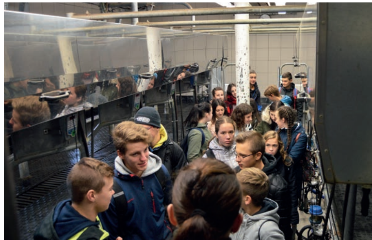
Exkurze žáků, Agrofito Lidečko, foto archiv školy.

Jsme malá vesnická škola na okraji Bílých Karpat. Tato malebná krajina přímo vybízí k ekologickému zaměření naší školy. Naše škola je plně organizována od 1. po 9. ročník. Škola poskytuje základní vzdělání v souladu se Školním vzdělávacím programem „Dobrá škola děti baví“. Škola pravidelně organizuje projektové dny, akce a soutěže v rámci environmentální výchovy.