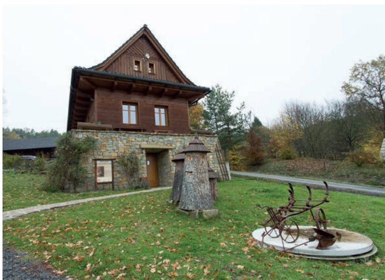
Envicentrum Vysoké Pole