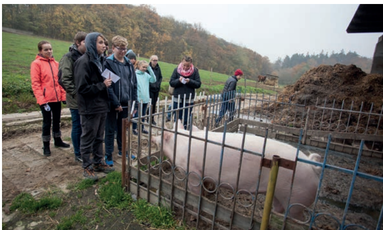
Exkurze žáků, Kozojedský Dvůr.

Jsme malá základní škola vesnického typu. Naše škola je environmentálně zaměřená a klademe důraz na seznámení žáků se zdejšími regionem. Pro nás je největším úspěchem hrdost našich absolventů na místo odkud pocházejí, na které se za námi rádi vrací.