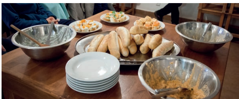
Exkurze žáků, Kozojedský dvůr, příprava svačiny z produktů farmy, foto J. Omelka.