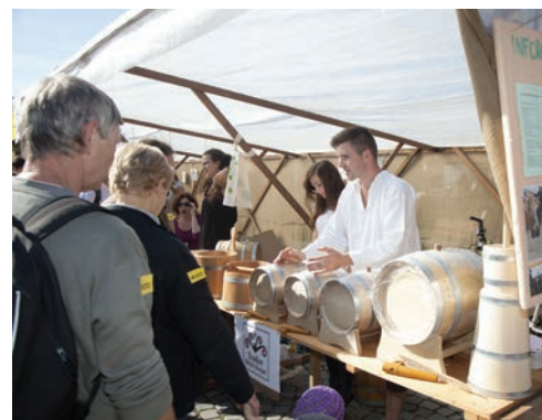
Podpora regionálních výrobců, Jablečná slavnost, Hostětín.