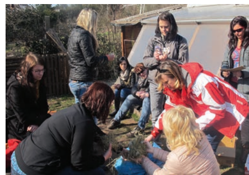
Jak učít POLY na zahradě, Lipka Brno.

Hlavním cílem projektu bylo podpořit profesní rozvoj učitelů, vedoucích a řídicích pracovníků mateřských škol v oblasti kurikulární reformy prostřednictvím dostupných, kvalitních a zajímavých vzdělávacích programů a stáží pro oblast polytechnického vzdělávání. Pro pedagogy mateřských škol máme 10 nových akreditovaných vzdělávacích programů, 7 metodických sad pomůcek (země, voda, vzduch, slunce, řemesla, zahrada a materiály), sborník 70 metodických listů (země, voda, vzduch, slunce, řemesla, zahrada a materiály), sborník tematických celků – příkladů dobré praxe z MŠ a deník ze stáží v 8 mateřských školách. Projekt spolufinancován z Evropského sociálního fondu a státního rozpočtu České republiky.