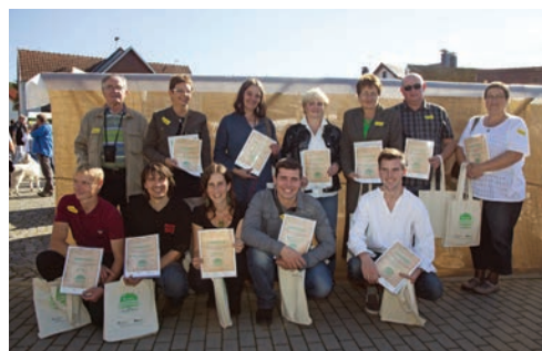
Držitelé certifikátu regionální výrobce podporující místní udržitelnou ekonomiku ve Zlínském kraji, Hostětín.

Podpořeno z Programu Švýcarsko-české spolupráce, Blokovaný grant – fond pro nestátní neziskové organizace.