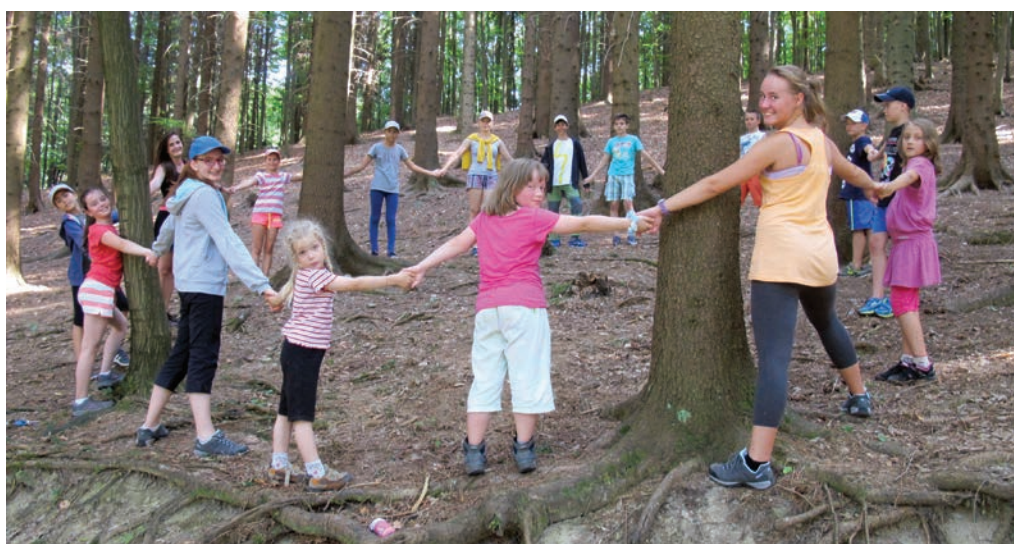
Prázdninový pobyt, Hájenka Smetín.

16. členská schůze proběhla dne 12. prosince 2014 v Domě dětí a mládeže Uherské Hradiště, v prostorách Přírodovědného centra Trnka.