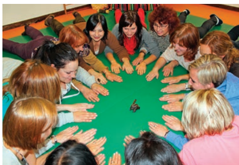
Vzdělávací akce pro učitele.