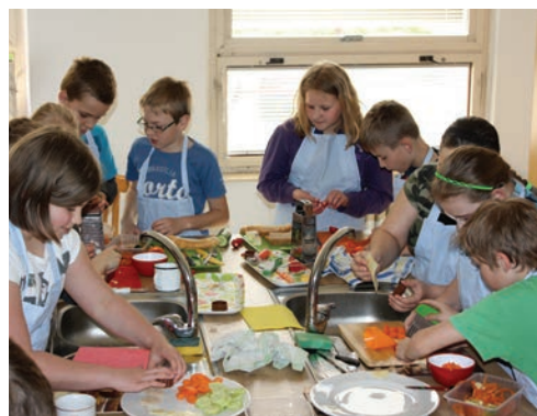
Výukový program Odkud se bere jídlo, ZŠ Vsetín, Sychrov 97.

V projektu jsme vytvořili akreditované vzdělávací programy, workshopy, pomůcky a poskytli metodickou podporu pro rozvoj vzdělávání v oblastech dopravní výchovy a zdravý životní styl v návaznosti na cíle RVP ZV, RVP GV a RVP SOV. Vše s cílem zvýšit porozumění obsahu a pojetí dopravní výchovy a vzdělávání k zdravému životnímu stylu, posílit klíčové kompetence žáků, profesní kompetence pedagogů a dalších pracovníků, zlepšit podmínky k využívání moderních metod a pomůcek i motivovat k dalšímu vzdělávání a spolupráci. LÍSKA zajistila jednu z pěti klíčových aktivit: Zdravá a bezpečná škola. Pro účastníky jsme vytvořili sady pomůcek a metodických textů. Příjemcem projektu bylo Středisko volného času Klubko Staré Město, p.o.