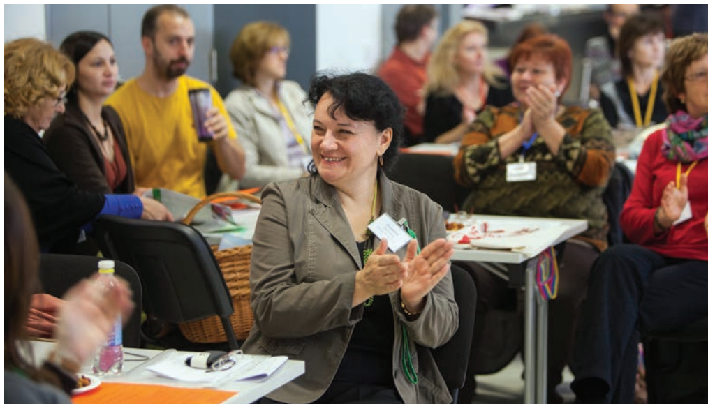
XIV. Krajská konference o environmentální výchově a vzdělávání, Zlín.

Kancelář LÍSKY sídlí v budově Základní školy Vsetín, Rokytnice 436. Otevřeno pondělí – čtvrtek: 8.30–12.00, 13.00–15.00 hodin.