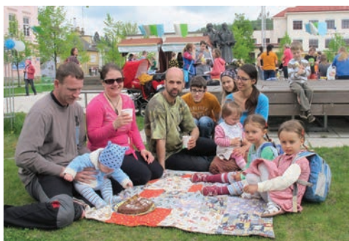
Férová snídaně, Vsetín.

Členové byli informováni o změnách v souvislosti s Novým občanským zákoníkem. Prostor byl i pro aktuální témata EVVO a informace z členských organizací.