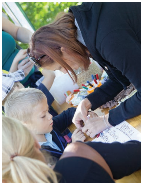
Osvětová kampaň Stromy a my – program pro rodiny s dětmi.