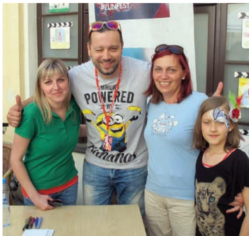
Mezinárodní festival filmů pro děti a mládež, Zlín.