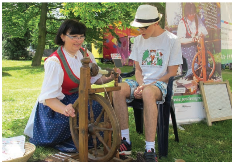
Mezinárodní festival filmů pro děti a mládež, Zlín.

Děkujeme našim rodinám a blízkým za jejich lásku a trpělivost.