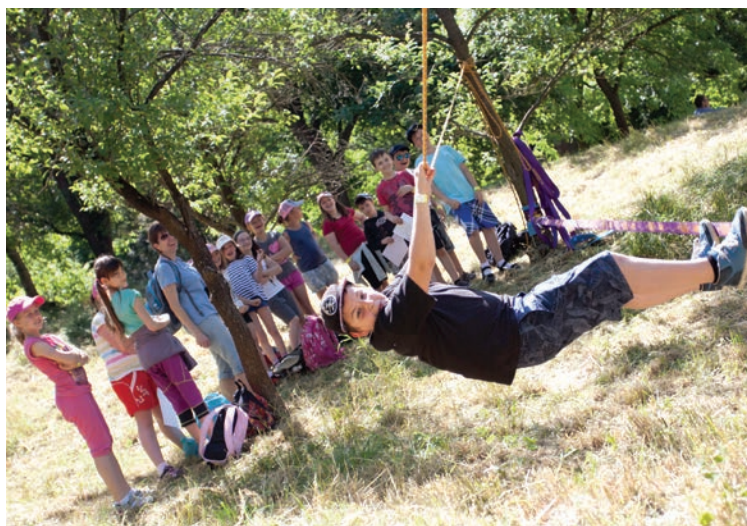
Dopolední, pobytové a terénní výukové programy pro školy.