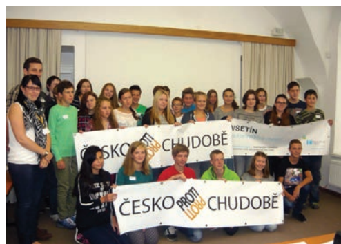
Vsetín proti chudobě – Vsetínské školy pro lepší svět.