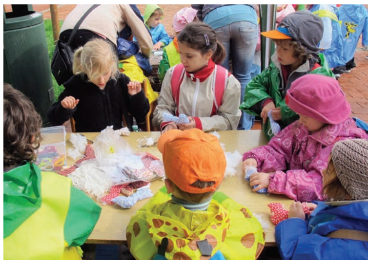
Den Země, Vsetín.

Naše aktivity byly v roce 2014 spolufinancovány z rozpočtu Zlínského kraje, města Vsetín, Blokového grantu – fondu pro nestátní neziskové organizace, Evropského sociálního fondu v ČR, Ministerstva školství, mládeže a tělovýchovy, Ministerstva životního prostředí.