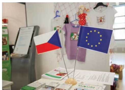
Metodické listy, pomůcky a projekty pro školy a neziskové organizace.