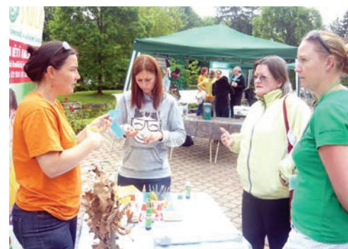
Krajský veletrh – Den pro přírodu, ZOO Zlín Lešná.